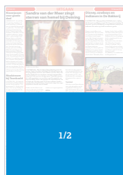
CD 102 VL (266 x 190) Factor 0,6