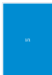
CD 101 V (266 x 398) Factor 1