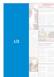
CD 102 VS (131 x 398) Factor 0,6