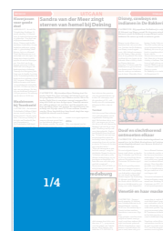
CD 104 BS (131 x 190) Factor 0,32