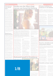
CD 108 BL (131 x 94) Factor 0,16