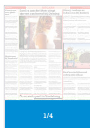
CD 104 VL (266 x 94) Factor 0,32